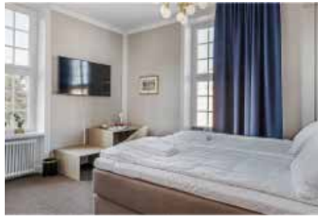
Hotellets T 1 rum

ratförening om respektive förenings program under året. Det var som vanligt en trevlig kamratföreningslunch med återseende av ansikten man inte sett på länge.