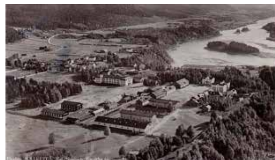
Arkivbild på T3 kasernområde

När inbetalningen är gjord är du/ni anmälda till träffen.