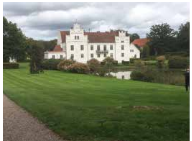
Vanås slotts baksida