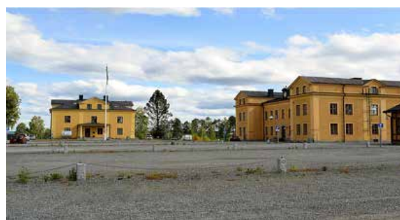
Bild på T3 kasernområde idag