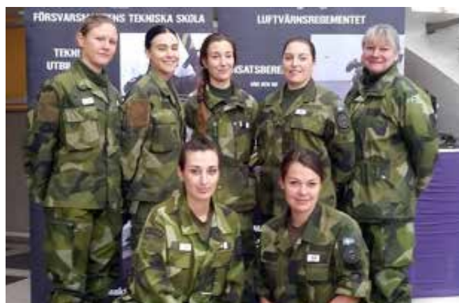
Exempel idag, kvinnliga tekniker.