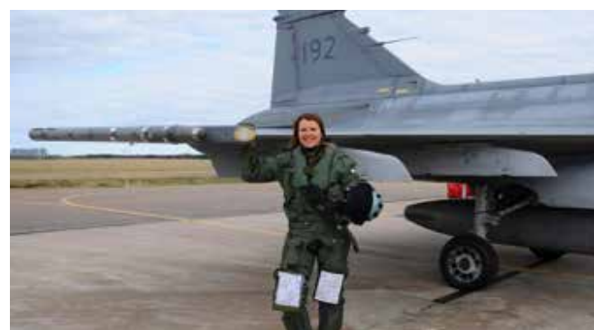
Exempel idag, kvinnlig stridspilot.