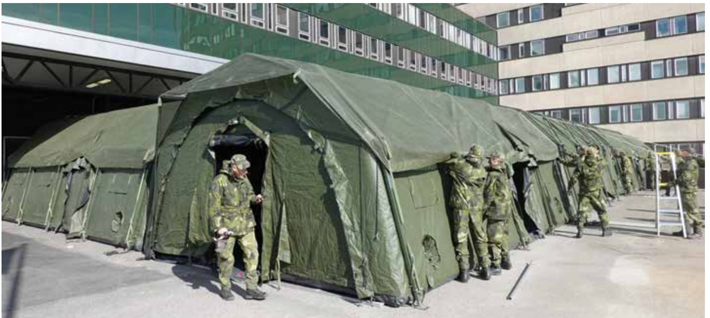
Fältsjukhuset vid Sahlgrenska sjukhuset.

plats för att ansvara för driften. Sahlgrenska Universitetssjukhusets och regionens har haft ansvar för att bemanna fältsjukhuset med medicinalpersonal.