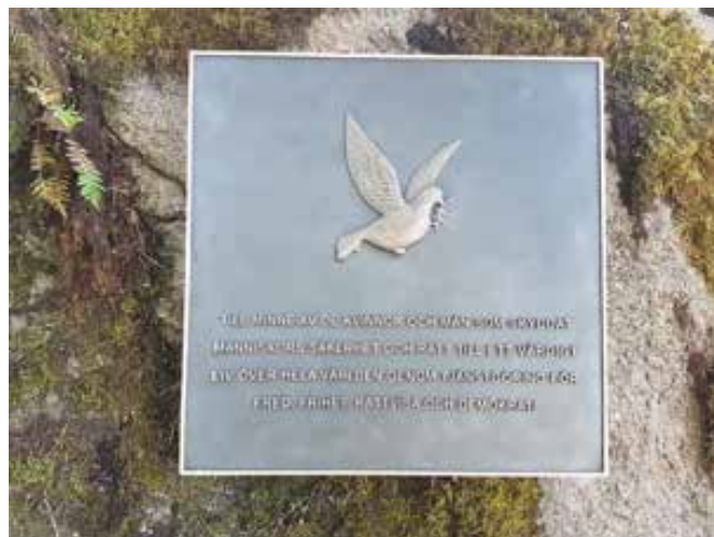
FN minnestavla vid Grenadjärgården.

Östergötlands veterangrupp har sedan en tid startat upp en ny träffplats i Linköping på Ryttargården Djurgårdsgatan 97. Där ett gäng veteraner träffas varje måndag klockan 17:00 till 19:00. Denna träffpunkt finns till för samtliga våra utlandsveteraner ung som gammal.