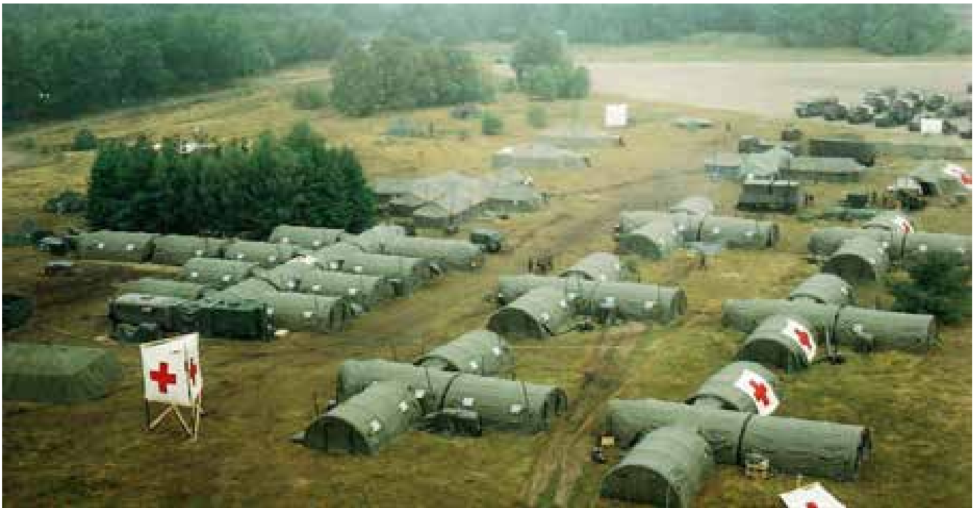
Upprättat fältsjukhus modell äldre.

Under den pågående pandemin har många röster hörts och påtalat det sorgliga beslutet under 90-talet att avveckla 34 fullt fungerande och vid tiden toppmoderna fältsjukhus. Dessa hade under nu rådande omständigheter kunnat tillföra en betydande kapacitetsförstärkning till sjukvården i kris. Det moderna fältsjukhuskonceptet utvecklades i Linköping genom ett unikt samarbete mellan T1 (Svea Trängregemente) och RIL (Regionsjukhuset i Linköping).