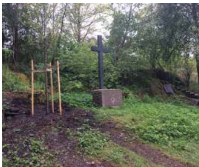
Korumplatsen vi Livgrenadjärernas friluftskyrka. FN minnestavla syns till höger

Från 1953 och framåt har 66 385 personer tjänstgjort i en internationell militär insats. Enligt Skatteverket var 54 809 av dessa vid liv i februari 2020. Veterandagen den 29 maj 2020 firades med en invigningsceremoni av en minnessten vid korumplatsen, Livgrenadjärernas friluftskyrka.