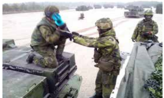
Bilder från verksamheten.