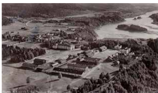
Arkivbild på T3 kasernområde

Corona pandemin medför att trängträffen för medlemmar med respektive dam från T1, T2, T3, T4 och Försvarslogistikklubben Stockholm årliga trängträff med T3 kamratförening som värd flyttas fram till hösten 2022. Mer information kommer i nästa nummer av Sveaträngaren 2021.