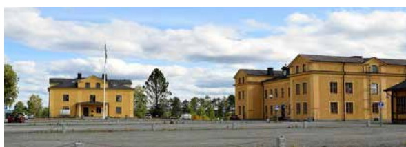
Bild på T3 kasernområde idag