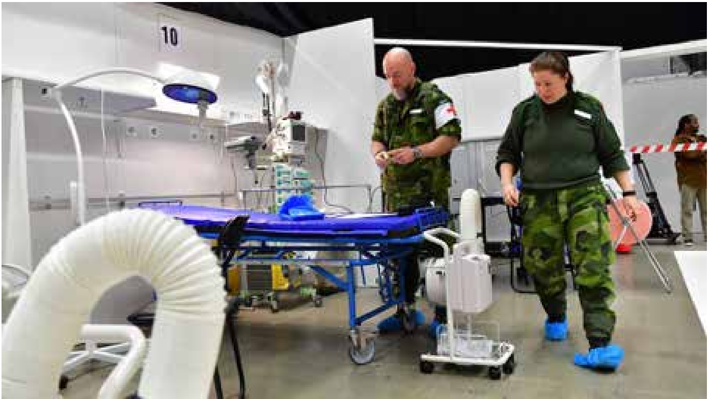
Interiör från fältsjukhuset i Älvsjö.

Även vid Östra sjukhuset i Göteborg ( Västra Götalandsregionen) byggdes det under mars månad 2020 upp ett fältsjukhus av Försvarsmedicincentrum med 20 intensivvårdplatser och 30 vårdplatser. Försvarsmedicincentrum har haft personal på