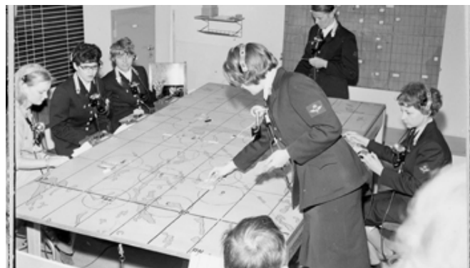
Flyglottor 1965.

Artikeln är skriven av Curt Sjöo och i huvudsak baserad på egna erfarenheter