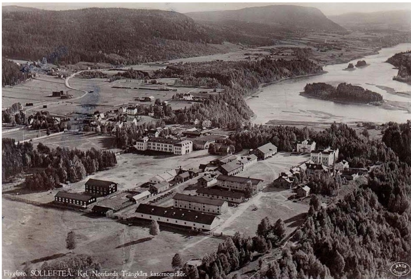
Flygfoto över Norrland Trängregementes kasern

Som jag tidigare nämnt så är ursprunget till alla trängregementen komna ur Svea trängkår. Så även Norrlands trängkår år 1893 vid Fredrikshov i Stockholm. Nedan har jag skrivit av den av en text hämtad ur Sveriges Försvar del 3 från 1928. Betänk att när denna text skrevs så var det endast 45 år sedan begynnelsen av förbandet. Så vi får väl anta att texten är förhållandevis färsk. Så håll tillgodo.