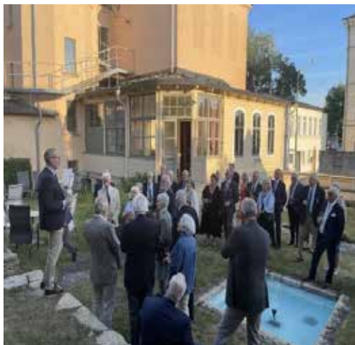
Bilder från mottagningen