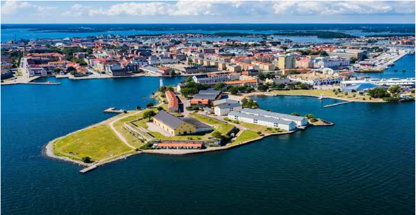
Foto över Karlskrona från allmänna bildida.

Årets Trängträff genomfördes i Karlskrona 4-6 september. Ansvarig för Trängträffen detta år var Försvarslogistikklubben (FLK). Ett 40-tal medlemmar från T 1, T2, T3, T4 kamratföreningar och FLK hade hörsammat kallelsen och infunnit sig i Karlskrona.