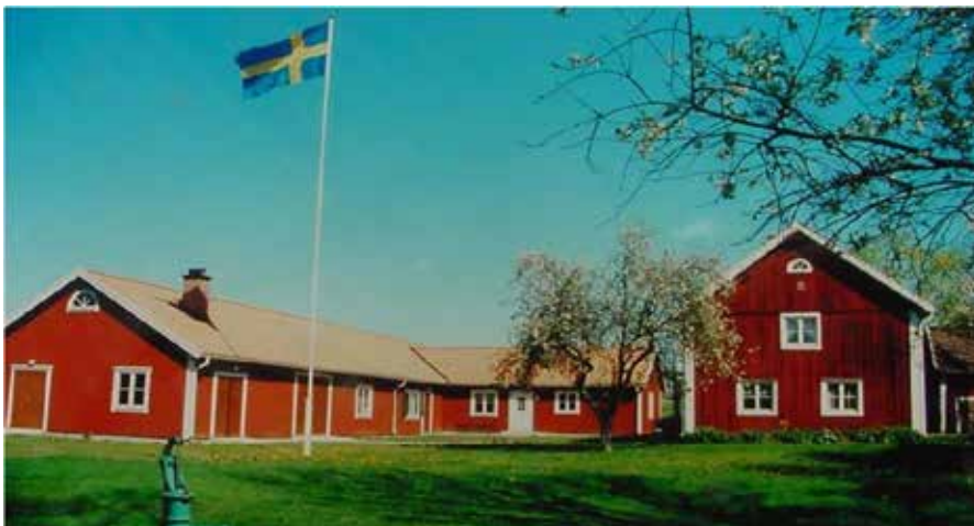
Sya hembygdsgård från allmänna bildmedia

Första stoppet gjordes vid Sya hembygdsgård, som bildades 1947 och efter hand skapat stora samlingar av bruksföremål i olika miljöer. Det är omfattande samlingar som tack vare medlemmar och andra har tillförts hembygdsgården. Under lokalsamhällets tid fanns i socknen en del hantverk och småindustri, även om jordbruket alltid dominerat. Detta förhållande slår naturligtvis igenom i karaktären på samlingarna.