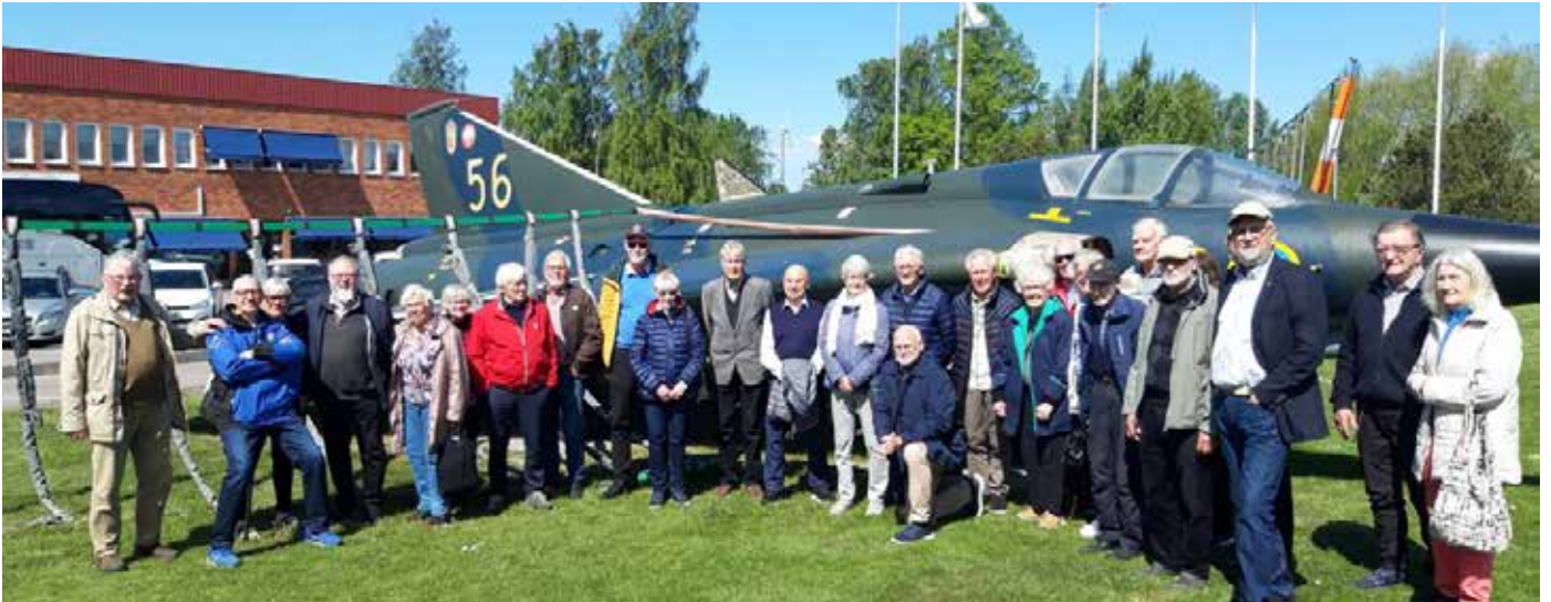
Intresserade deltagare vid SCAMA Väderstad

Utflykten avslutades med ett besök på Motala Motormuseum vid hamnen. Museet öppnade 1995 på basis av grundaren Jan-Ove Bolls privata samling. Museet har cirka 160 000 besökare årligen. Museet har restaurang, kafé, souvenirbutik och hotell i samma byggnad.