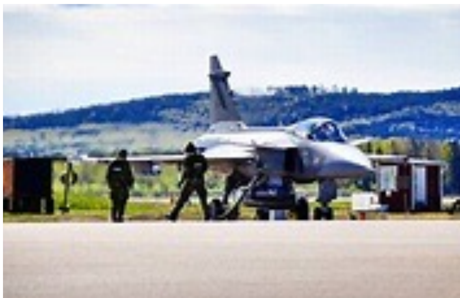
Foto från Marinmuseet och klargörning av Jas Gripen från allmänna bildmedia