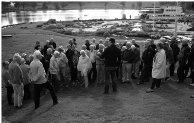
Intresserade åhörare vid Göta Kanal

Guiden berättade om de tekniska problemen och lösningarna som var förknippade med byggnationen.