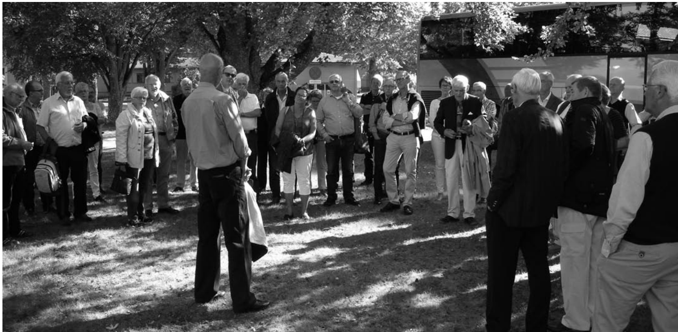
Ordföranden hälsar deltagarna välkomna

Den 12-13 september var det dags för kamratföreningarna vid T1, T2, T3, T4 samt Trängklubben att samlas till den årliga trängträffen.