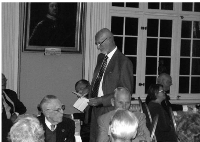
Ordföranden hälsar välkommen till bords