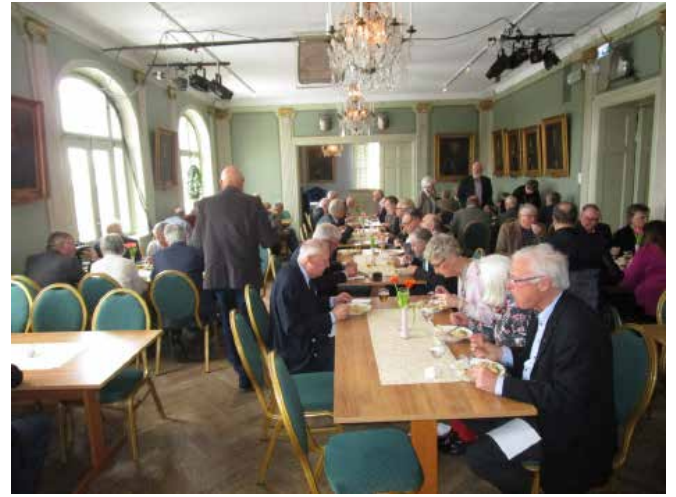
Regementsförbrödring över lunchen