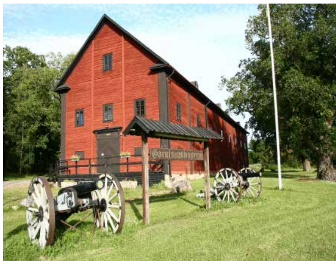
Linköpings tidigare garnisonsmuseum