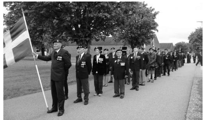
Svenskarna klara för marsch

Första dagen började mötet med en högtidlig öppning med flagghissning och kransnedläggning för att hedra omkomna danska kamrater. Därefter följde sedvanlig marsch genom staden på gruppkolonner med regementets musikkår i spetsen. Ålborgs stad bjöd på en uppskattad mottagning och efter den fick