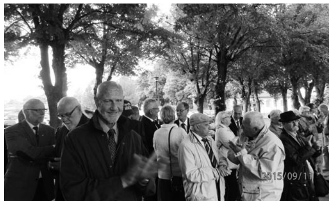
Deltagarna hälsas välkomna.