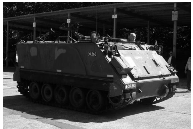
Stridsfordon vid garnisonsmuséet.

Den näst sista dagen i Ålborg, fick vi besöka försvars och garnisonsmuséet. Det var inrymt i en stor tyskbyggd hangar. Här visades en stor mängd materiel främst från ockupationstiden i Danmark men även från andra tider. Bland annat fick vi besöka en tyskbyggd bunker. Muséet hade också en utställning som hade 70 år efter kriget som tema.