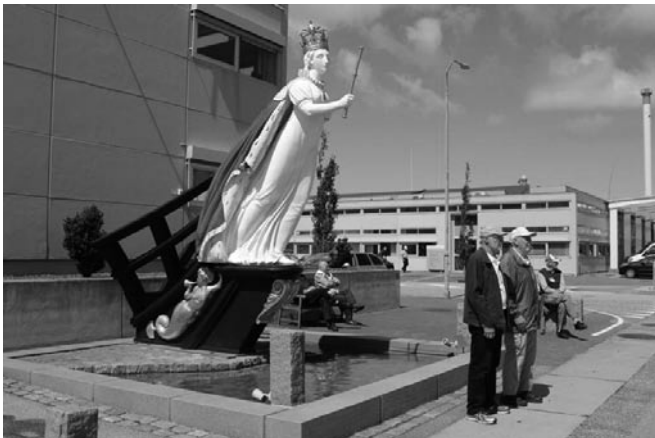
Tre galjonsfigurer i hamnen

Trängregementet är en av Danmarks största militära utbildningsplatser med cirka 2000 befäl, civilanställda och värnpliktiga. Vid regementet finns två logistikbataljoner, en underhållsbataljon samt flera mindre enheter bland annat försvarets militära poliscenter. En del av tiden ägnades åt förevisning av materiel som finns vid regementet. Nästan alla fordon har splitterskydd och mycket av verksamheten utförs i containrar för att ge skydd mot splitter och ha all materiel på plats för att direkt kunna påbörja avsedd verksamhet.