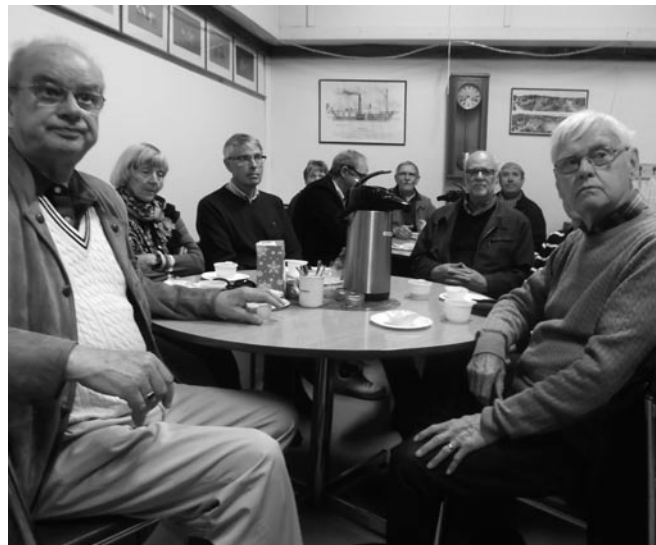
Information över en kopp kaffe