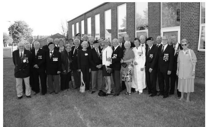
Svenska enheten i Ålborg.

Kvällen denna dag avslutades med en stor festmiddag med ett digert program med danska, svenska, norska och finska inslag. Nästa morgon avfärd till respektive hemländer. Vi tackar danskarna för ett informativt och trevligt möte.