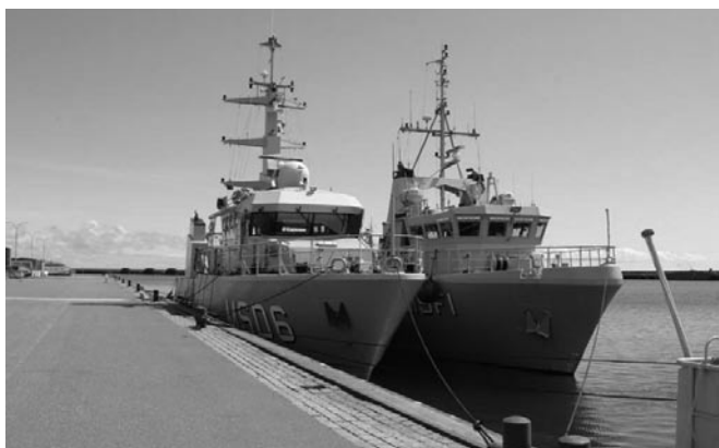
Fregatt(er) i Kattegatt.

Besöket i marinbasen började med att vi fick bekanta oss med en helt ny simuleringsanläggning. Där vi fick öva oss i att framföra fartyg till sjöss utan att köra på andra fartyg, broar eller oljeplattformar. Därefter fick vi gå ut till hamnområdet och se hu-