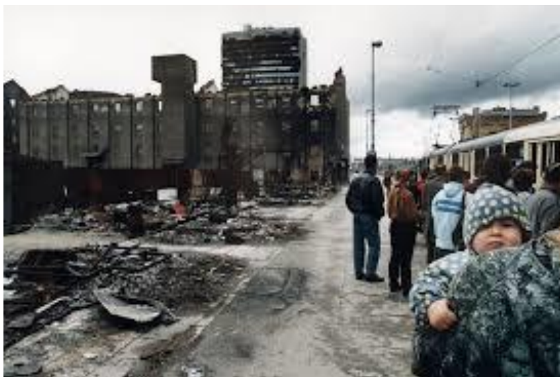
Vid några få tillfällen kunde kvinnor och barn evakueras

Vår uppgift var främst att observera och rapportera händelser i Sarajevo. Vi besökte frontlinjer och kröp i skyttevärnen (ibland inte mer än 15 m mellan de stridande parterna), räknade inkommande och ibland också några utgående granater, bekräftade civila förluster (skadade/döda), försökte göra krateranalyser för att fastställa varifrån man hade skjutit. All denna information användes sedan vid förhandlingsbordet. Naturligtvis ägnade vi en stor del till att också försöka underlätta för befolkningen rent humanitärt.