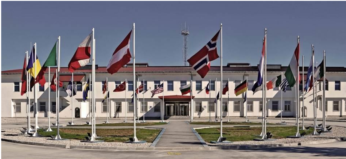
Camp Butmir, EUFOR och NATO HQ

EUFOR är c:a 600 i bemanning varav två svenska stabsofficerere. Totalt ingår 16 EU-nationer och 5 icke EU medlemmar där Österrike, Ungern och Turkiet dominerar. De svenska befattningar finns i Capacity Building and Training Division (CBTD) i EUFOR HQ. Den ena är en OF 4 som Chef Training Planning and Coordination Branch (TPCB) och i samma sektion återfinns OF 3 som Staff Officer External Coordination (SO EXT COORD).