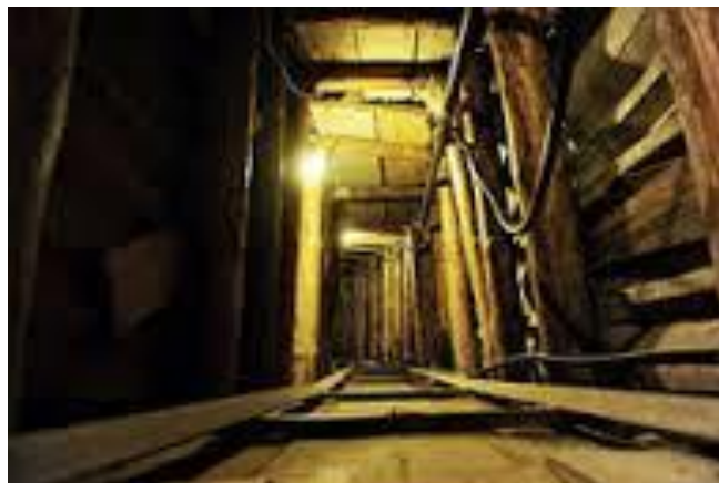
Den "icke existerande" tunneln under flygplatsens start och landningsbana

I övrigt blev man verkligen imponerad av personalen på Sarajevo's tre sjukhus. Trots knappa resurser och överarbetad personal var man oerhört effektiv när massskadesituationer uppstod. Det tog aldrig lång tid att prioritera och sortera de skadade fastän man som lekman upplevde det hela som ett enda stort kaos. Tyvärr var effektiviteten byggd på år av erfarenhet av granatbeskjutning.