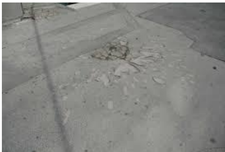
Sarajevoros, nedslag från en granat