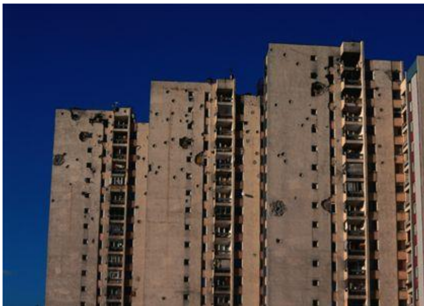
Dobrinja, f.d. Olympiabyn