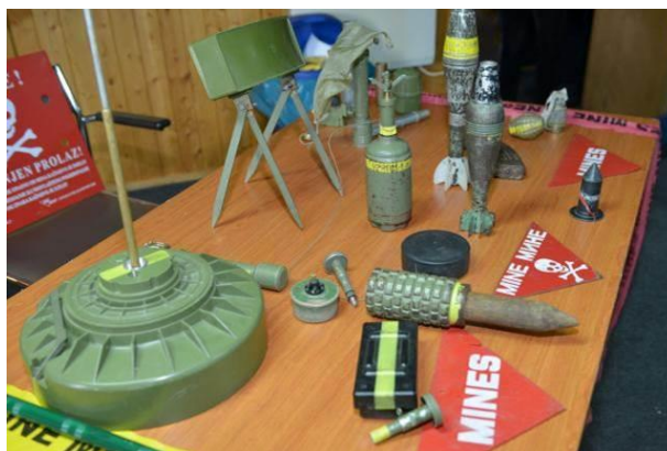
EUFOR utbildar också befolkningen i "Mine awareness"

Som C TPCB är man ansvarig för den långsiktiga planeringen av AFBiH övningar med målbild enligt ovan. Det blir många möten internt men också med AFBiH Joint Staff. Varje år genomförs en Assessment Conference, EUFOR och AFBiH gemensamt, där man validerar årets genomförda övningar och tar fram nya behov för kommande verksamhet. På sikt skriver man på ett "avtal" som beskriver kommande års verksamhet. EUFOR ledning är i Bryssel, European Staff Group (EUSG) och via dem begär man hjälp av truppbidragande länder att skapa Mobile Training Team som på sikt kommer att genomföra träningen. EUFOR har själv begränsad kapacitet för själva träningen. Den Multinational Battalion (MBN) som finns i Sarajevo genomför också Combined Training (förbanden övar tillsammans) med AFBiH.