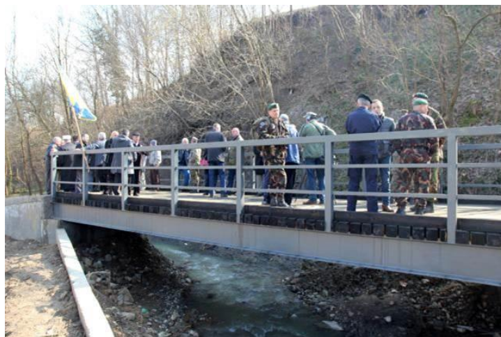
Utbildning i brobyggnad.

EUFOR främsta uppgift är att utbilda den Bosniska Armén (AFBiH) så att de når upp till internationell standard (Euro-Atlantisk) för att kunna ingå i internationella fredsuppdrag och även bistå vid nationella katastrofer. AFBiH har också ett antal Partnerships mål att uppfylla. På sikt vill man gärna ingå i NATO. Det är en sekundär uppgift för EUFOR att bevaka freden. Det gör man främst genom att följa upp läget med ett tiotal Liaison Observer Team (LOT) spridda runt om i BiH.