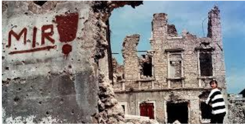
MIR betyder fred

han i närvaro av stabschefen lovade att samarbeta fullt ut. Dagen därpå "slängde" han ut mitt team från P4 när de kom till hans HQ och jag tröttnade och stängde P4. Det kom att drabba civilbefolkningen och blev en prestigeförlust för 1.kåren. Anledningen var egentligen att vi motarbetade brigadschefens svartabörsverksamhet och att han kunde uppträda så "obstinat" mot sina chefer berodde på hans kontakter med den högsta politiska ledningen, han hade varit personlig vän och livvakt åt president Izobegovic´.